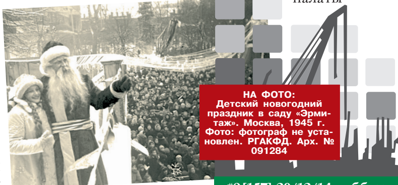
НА ФОТО: Детский новогодний праздник в саду «Эрмитаж». Москва, 1945 г. Арх. № 091284

Газета Новороссииской торгово-промышленной палаты